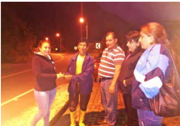
Estuvimos cuando más nos necesitaban