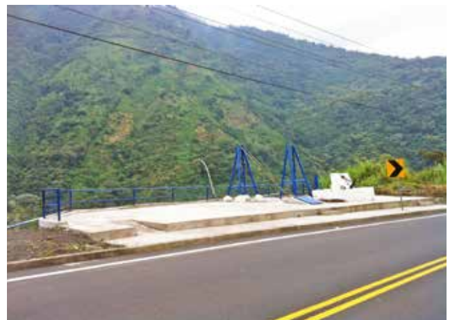
Construcción de un muro para la protección de las torres de agua en el sector El Placer

Durante estos cinco años, hemos estado en contacto con nuestra gente, para conocer las necesidades de sus comunidades y poder solventarlas.