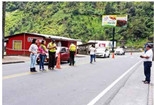
Recolección de fondos para ayuda social