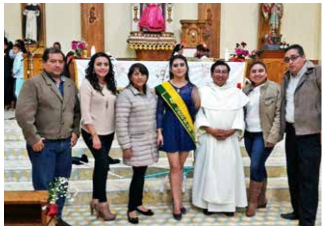
Festividades de parroquialización