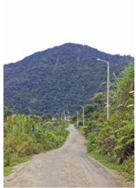
Alumbrados públicos sectores: San José, La Playa, sendero Río Verde - El Corazón, camino al Centro de Salud

La promoción turística de nuestra parroquia ha sido constante, para lo cual se han utilizado diferentes medios, como por ejemplo la colocación de vallas publicitarias.