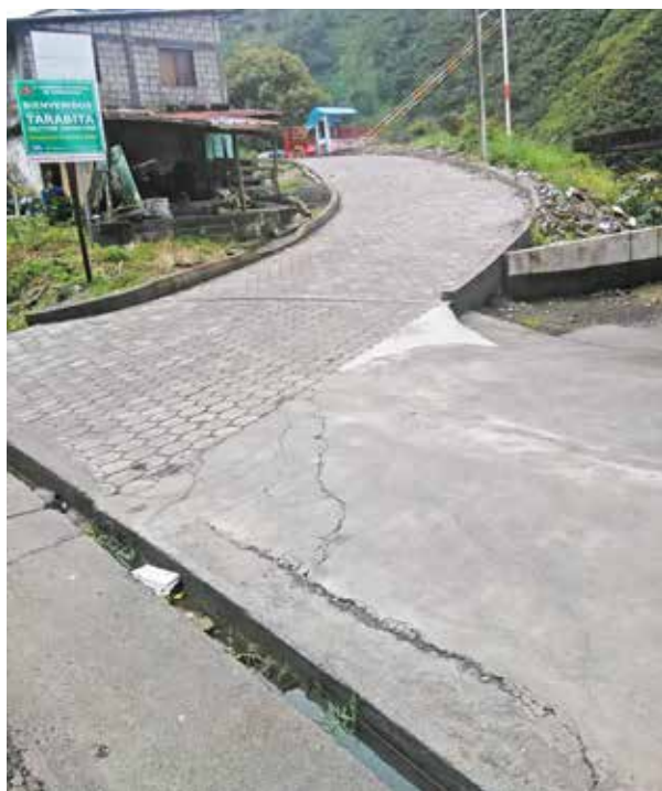
Adoquinado Chinchín-Manto de la Novia