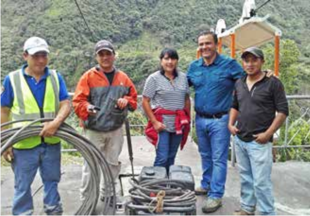
Apoyo a mingas comunitarias

El trabajo conjunto entre moradores, autoridades e instituciones nos permitió mejorar la presentación de nuestra parroquia.