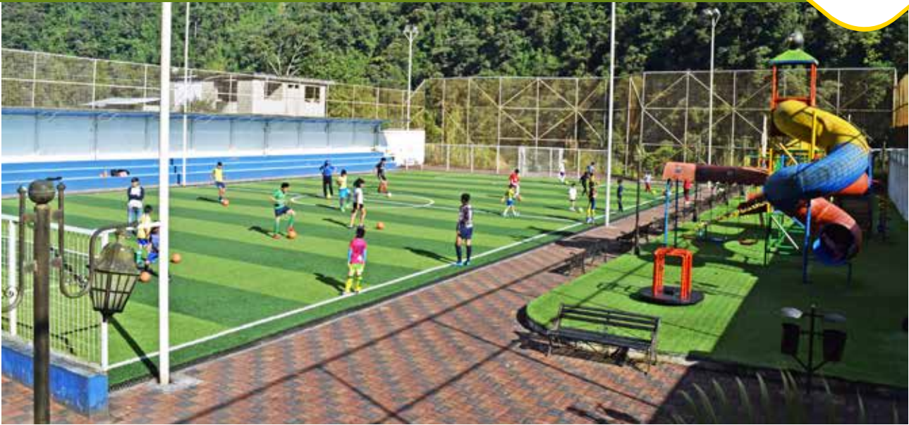
Construcción de la cancha sintética