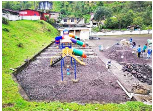
Colocación de juegos infantiles