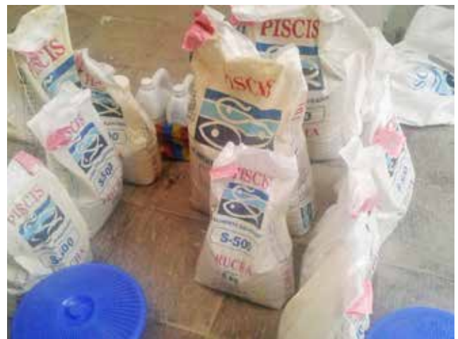
Entrega de alevines y balanceado a los piscicultores de la parroquia