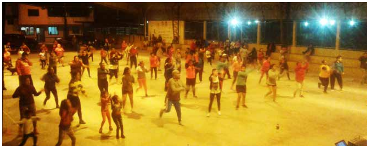
Con la rumbaterapia, apoyamos al mejoramiento de la salud de nuestra gente