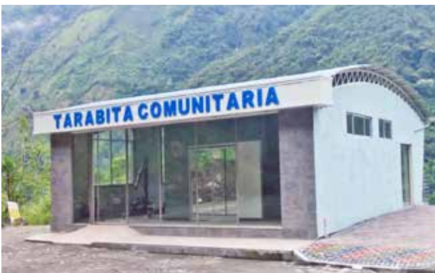
Reubicación tarabita San Pedro - después