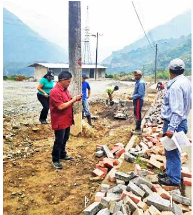
Adoquinado de veredas