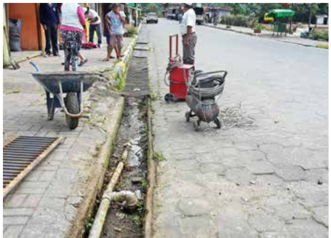
Cambio de rejillas en el barrio San Miguel