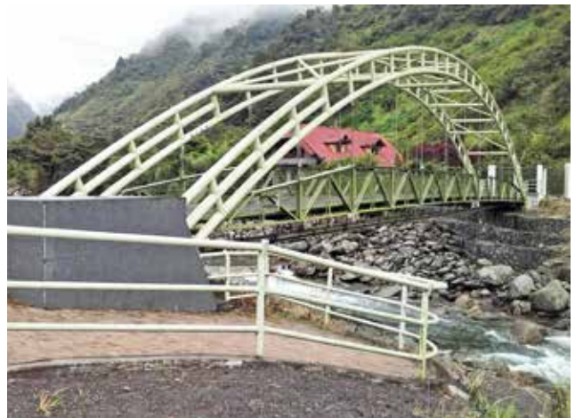
Construcción y alumbrado del puente Miramelindo