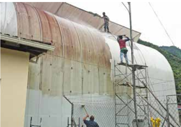
Limpieza del orquideario