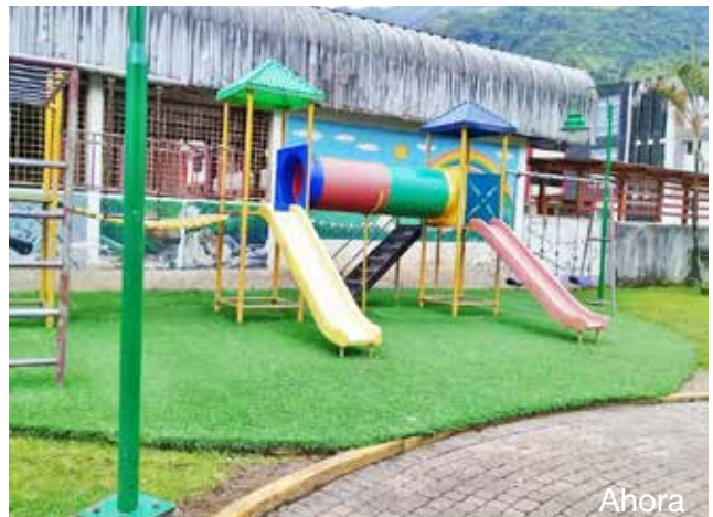
Colocación de césped sintético