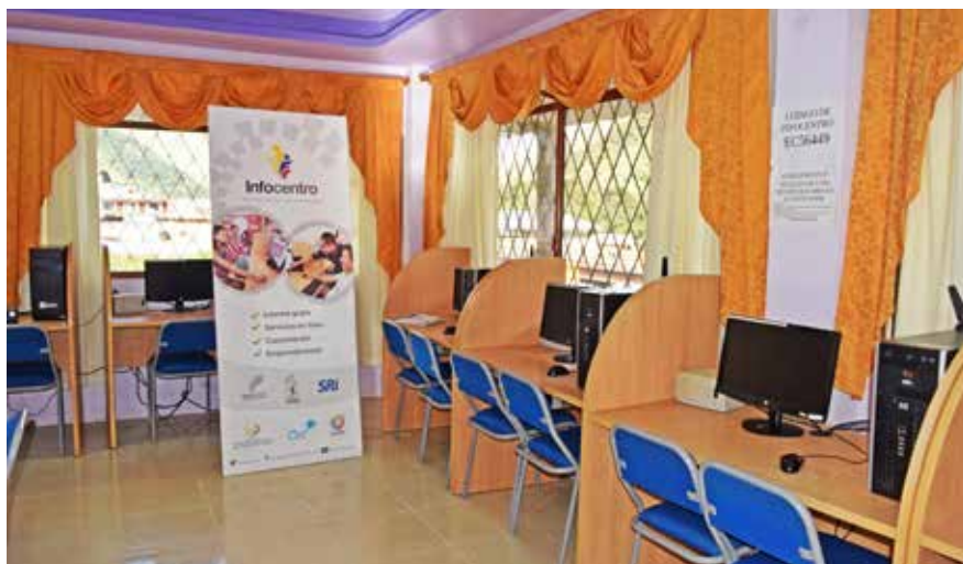
Entrega de computadores para el Infocentro, en convenio con el Ministerio de Telecomunicaciones.