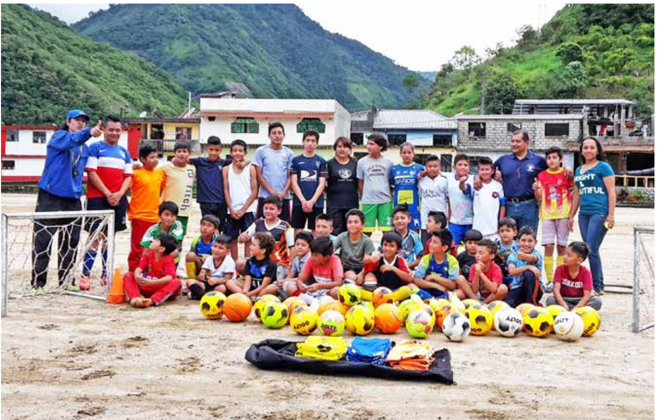
Entrega de implementos deportivos a la escuela de fútbol