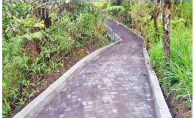
Adoquinado camino al cementerio