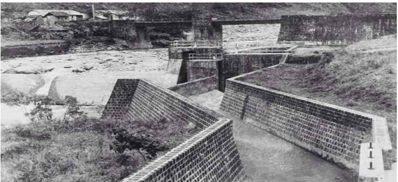
Compra de las ruinas de la primera hidroeléctrica del país, para proyecto turístico