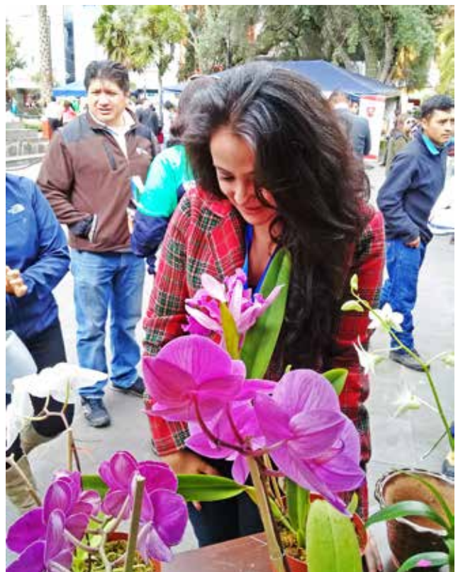
Participación en ferias con el orquideario