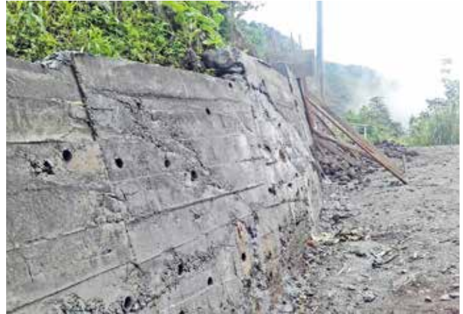
Construcción de un muro en El Placer - Nueva Libertad