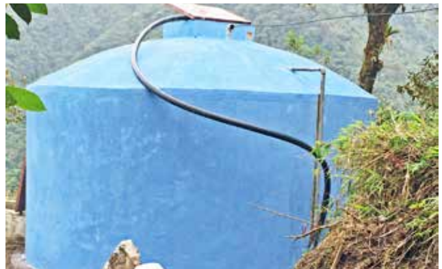
Sistema de agua potable y tanques