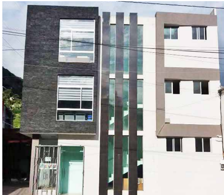
Construcción del nuevo edificio del GAD Parroquial