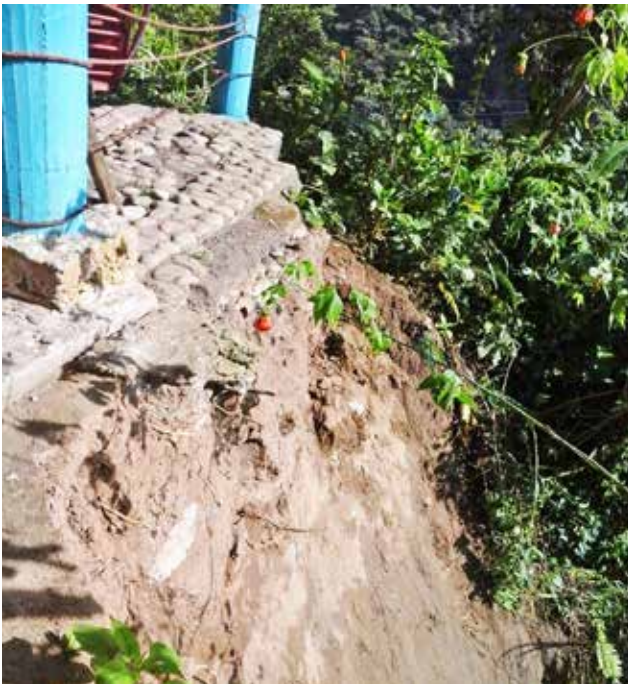
Reubicación tarabita comunitaria - antes