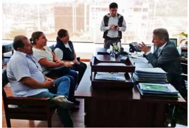
GAD Provincial de Tungurahua