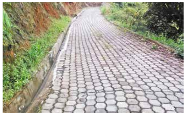
Adoquinado El Puyal