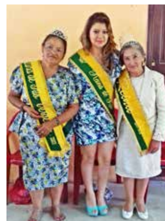
Elección de Reina del Adulto Mayor