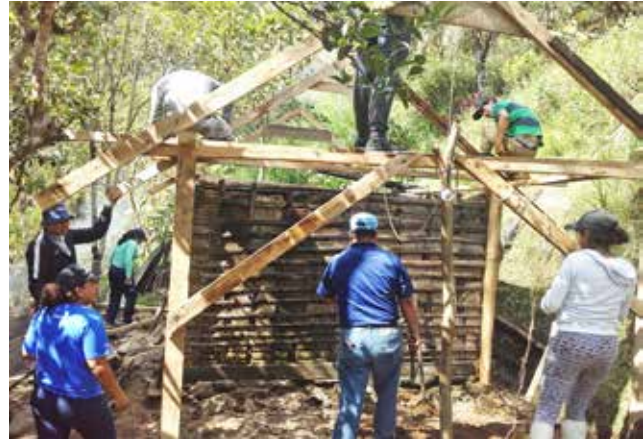
Vivienda reconstruida de persona de escasos recursos