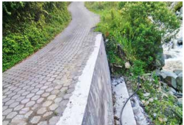
Construcción de un muro, sector Río Verde La Regina