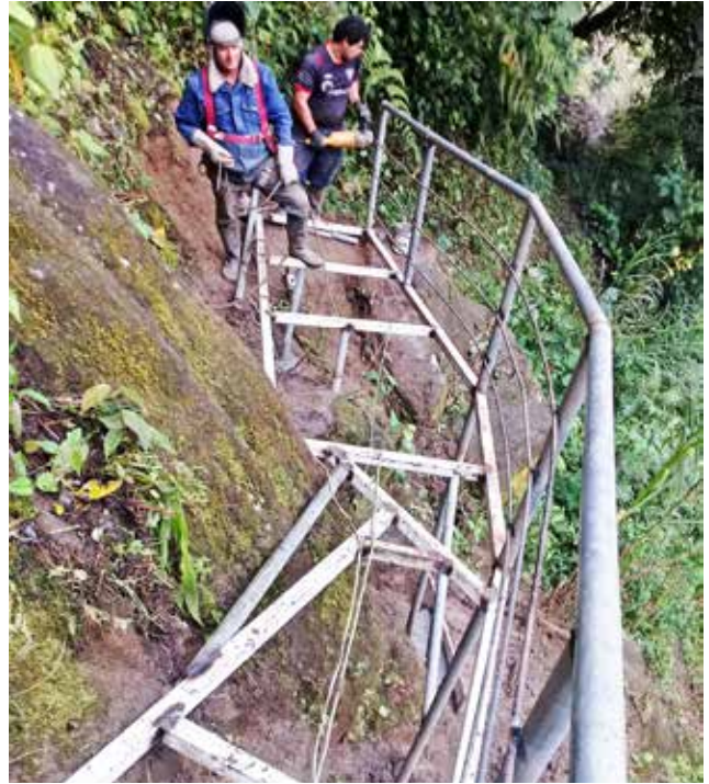
Construcción de puente hacia la planta de tratamiento