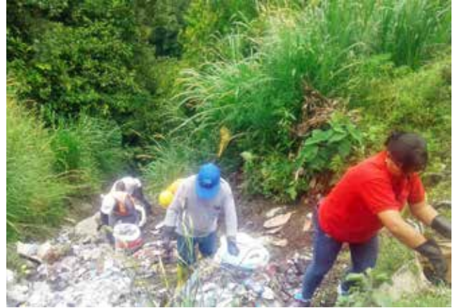
Limpieza del mirador al Pailón