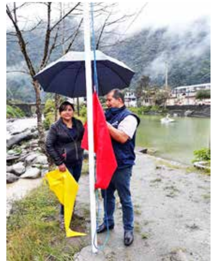
Colocación de señalética preventiva en las riveras del Río Verde