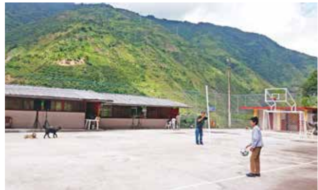
Pavimentación - después