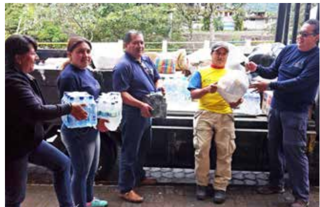
Apoyo a afectados del terremoto de Manabi