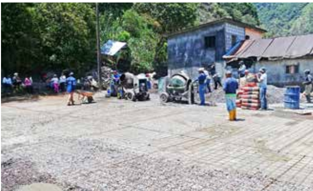
Pavimentación - durante