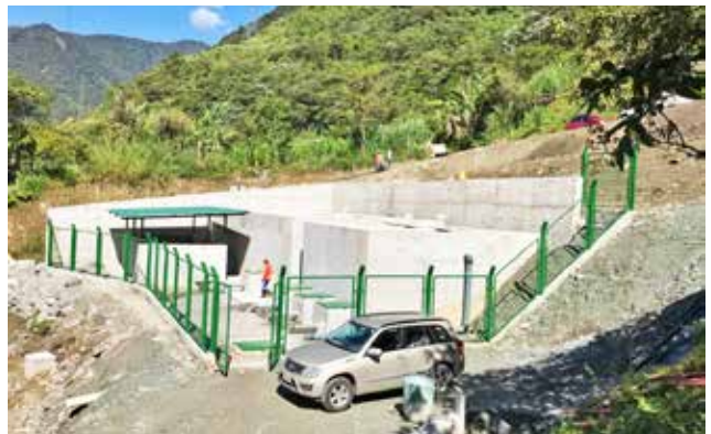
Redes de alcantarillado y planta de tratamiento del sector Machay - Cadenillas