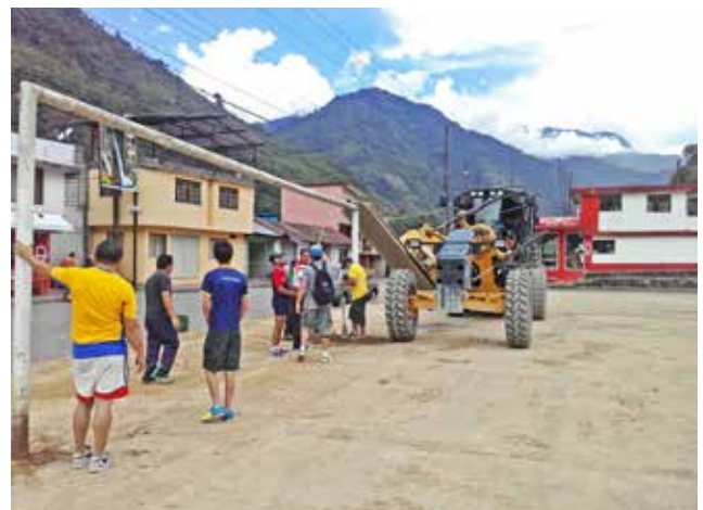
Mantenimiento del estadio de la parroquia