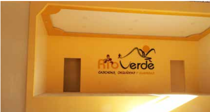
Arreglo de escenario y camerinos en el coliseo parroquial