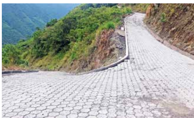
Adoquinado La Merced - El Corazón