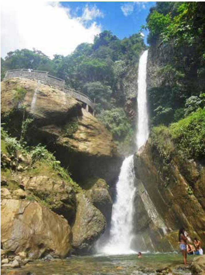
Mejoramiento de sendero hacia la cascada en el caserío Machay, por el fuerte temporal invernal.