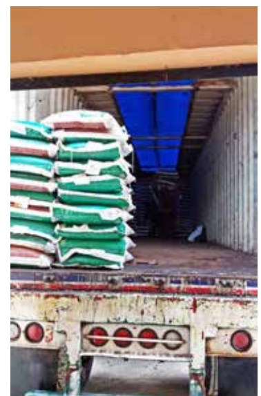
Entrega de abono a agricultores de la localidad, mediante convenio con CELEC EP