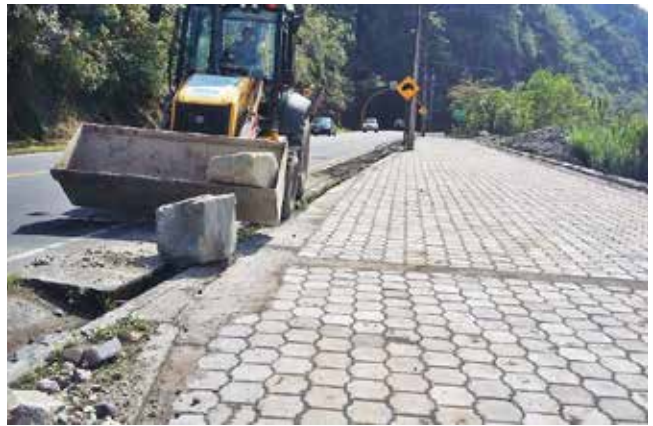
Muro y adoquinado sector Quilloturo