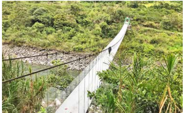
Arreglos del puente El Placer - Nueva Libertad