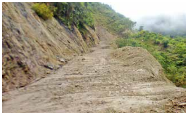
Rehabilitación - después