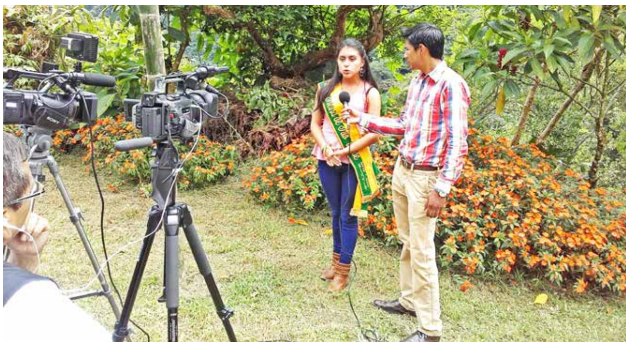
Promoción turística de la parroquia por canales de televisión nacionales