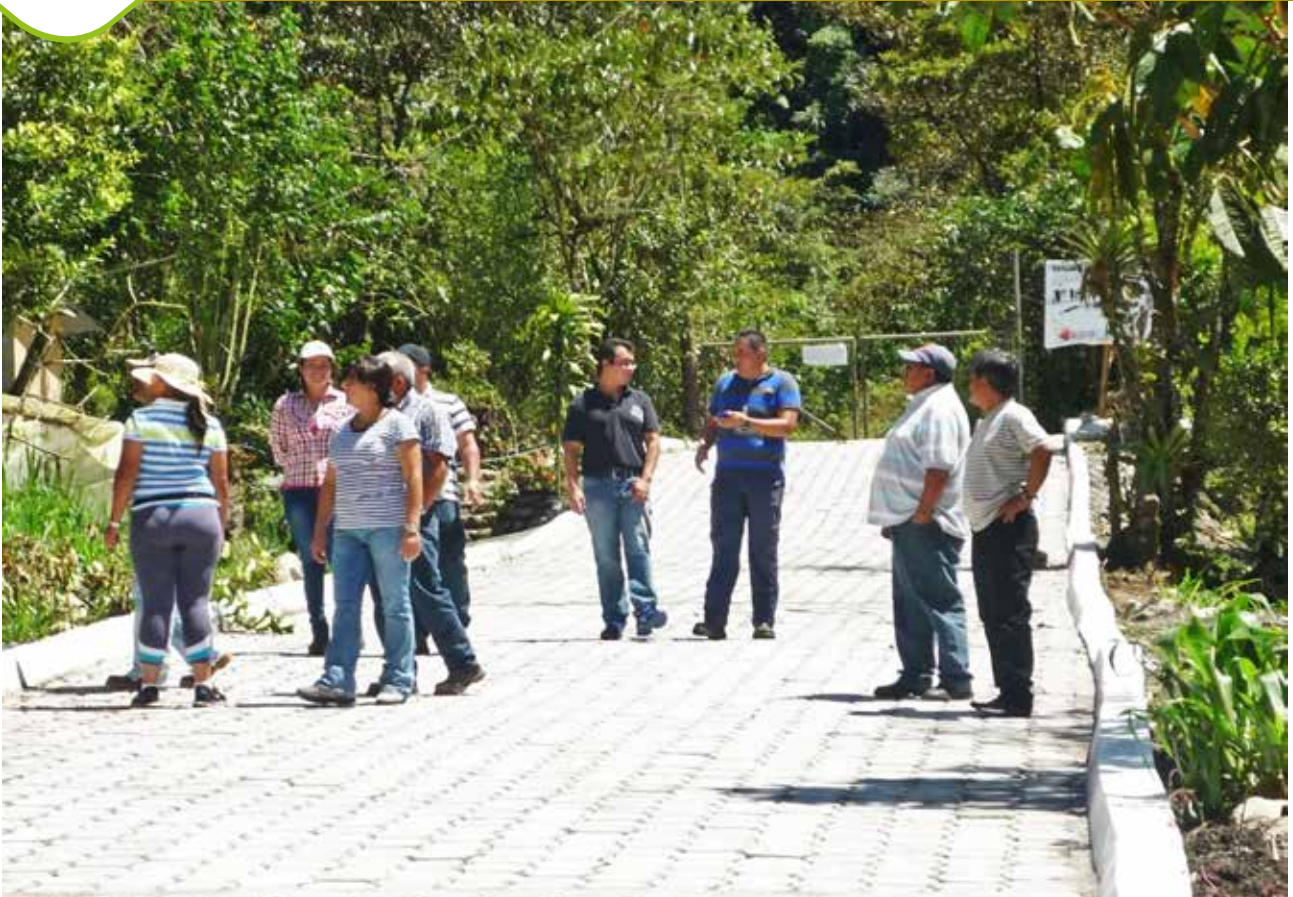
Adoquinado en Machay - Calle Mariposario