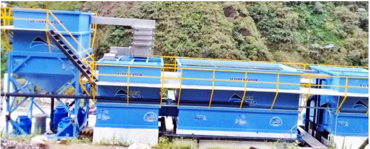
Construcción del nuevo sistema de agua potable para la parroquia