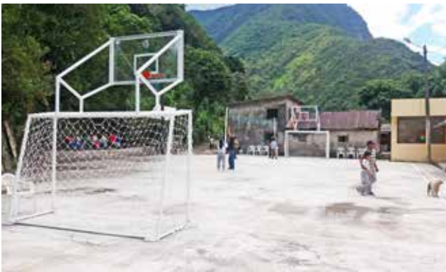
Dotación de arcos