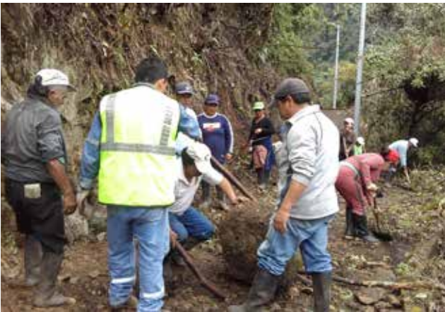
Limpieza de caminos