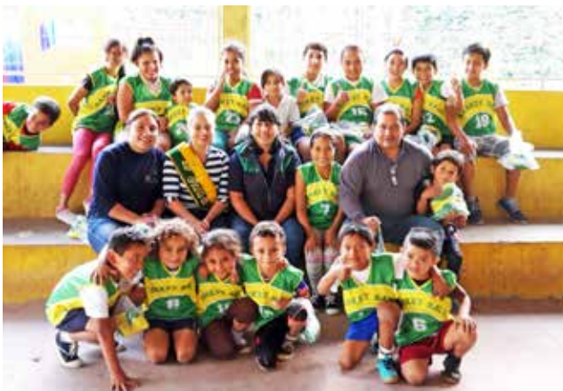
Uniformes a escuela de básquet