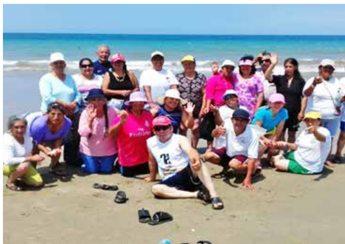
Gira de recreación adultos mayores