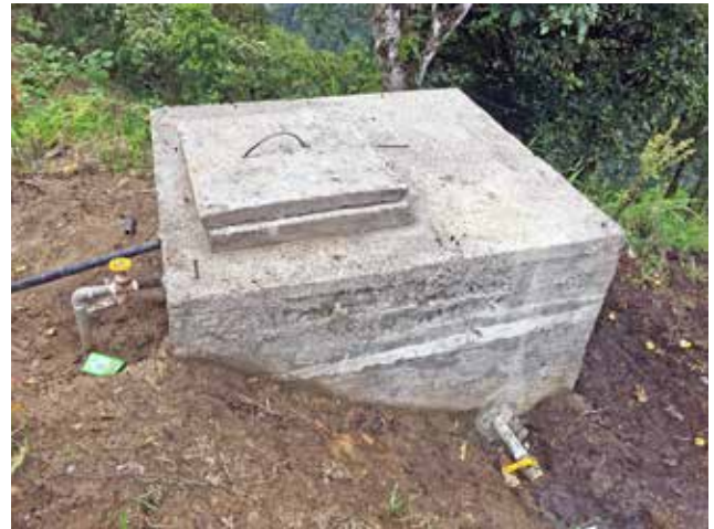
Sistema de agua San Jorge - La Escudilla