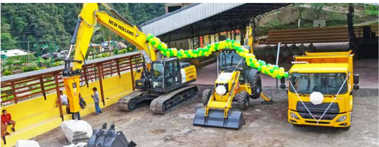
Compra de maquinaria