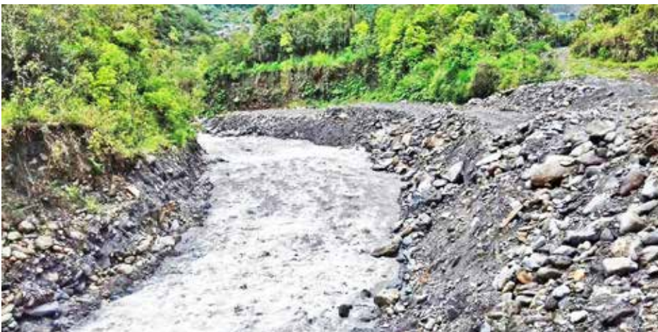
Desazolve sector Machay