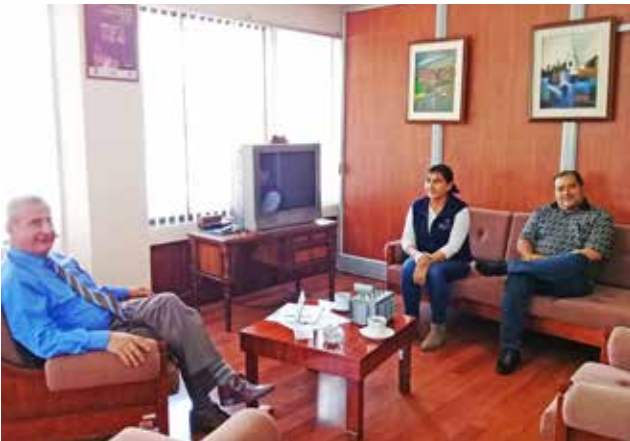
Empresa Eléctrica Ambato S.A.