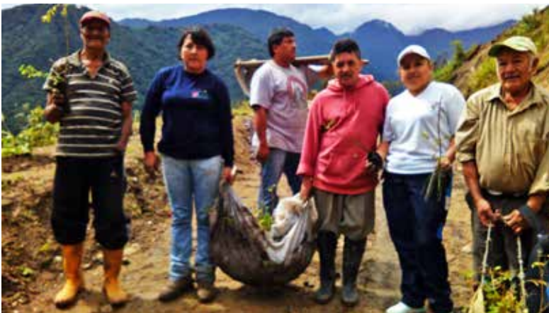
Siembra de árboles nativos convenio con CELEC EP