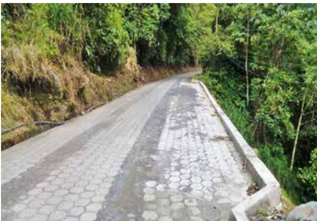
Construcción de un muro, sector vía antigua a La Barbacha