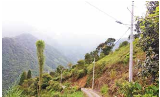
Alumbrado La Merced - El Puyal