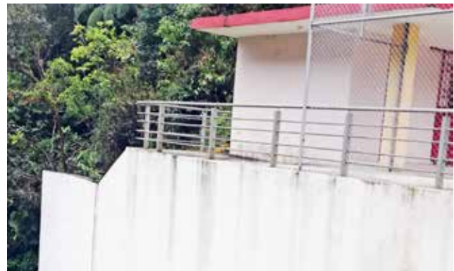
Muro de protección de baterías sanitarias