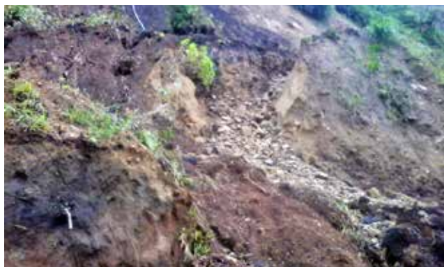
Rehabilitación La Merced - El Corazón