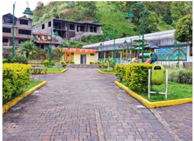
Construcción de baterías sanitarias