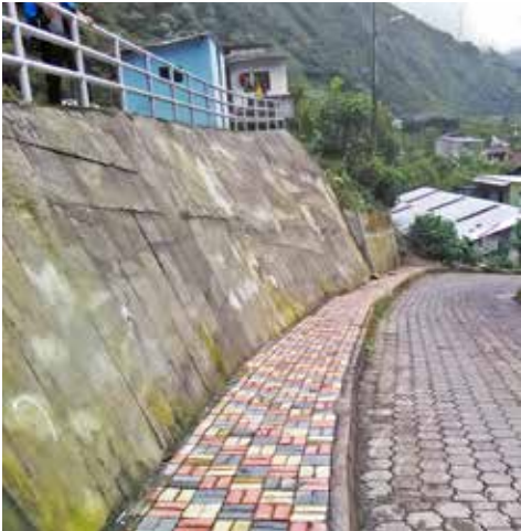
Muro ingreso a El Placer