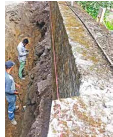
Construcción del anclaje del muro en la vía antigua junto al centro de salud