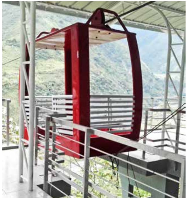
Construcción tarabita San Pedro