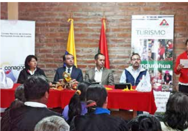
Universidad Técnica de Ambato