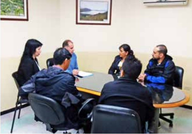
Firma de convenio con CELEC EP

Varias autoridades e instituciones han sido nuestras aliadas, con quienes firmamos convenios para la ejecución de obras en nuestra parroquia, mejorando las condiciones de vida de la población.