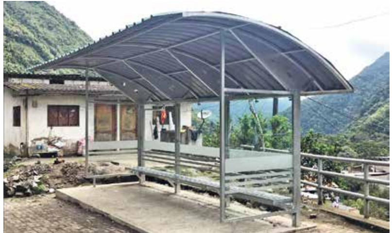
Parada de buses