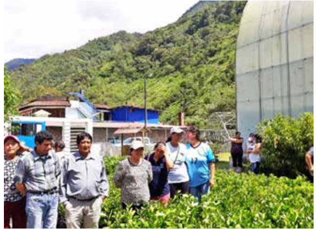
Entrega de plantas frutícolas mediante convenio con CELEC EP