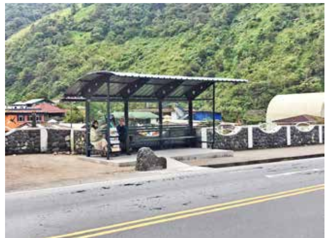
Construcción de paradas de bus en Río Verde