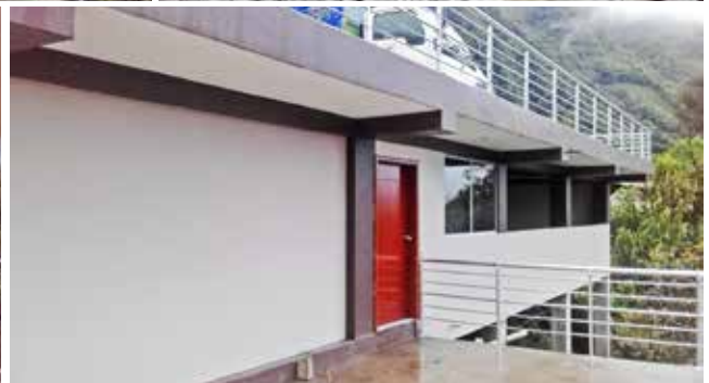
Construcción de loceta, plazoleta y parqueadero