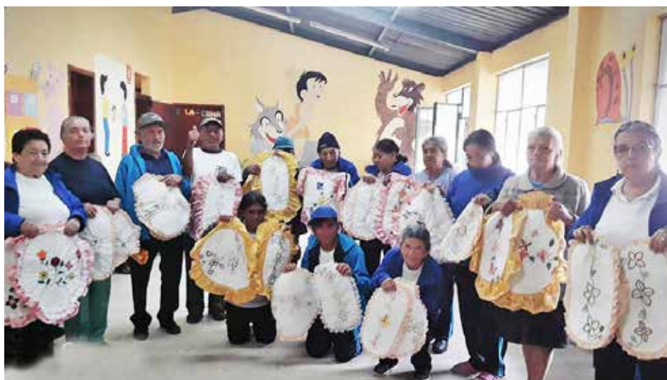
Trabajos de artes plásticas con grupos vulnerables