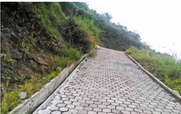
Adoquinado La Merced - El Puyal