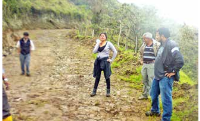
Rehabilitación de sendero