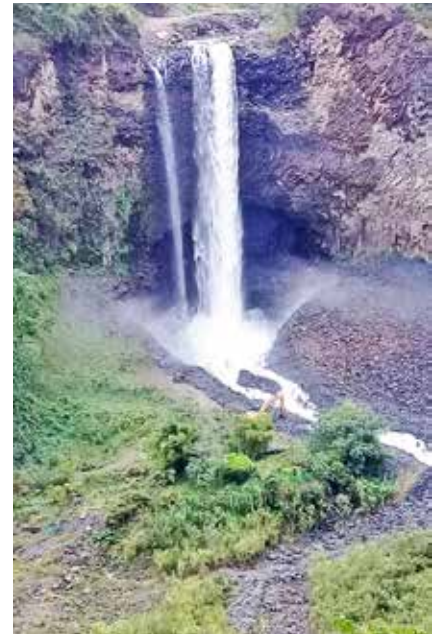
Desazolve del Río Chinchín