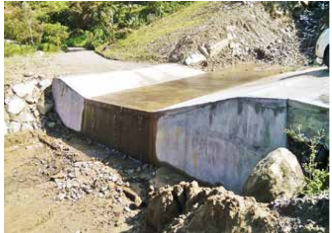
Colocación de adoquinado y construcción de un badén, sector La Playa