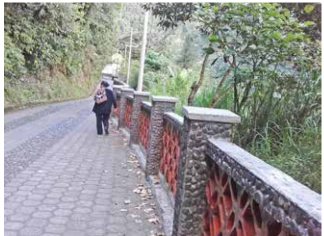
Mantenimiento y arreglo de cunetas en la antigua vía hacia el Centro de Salud