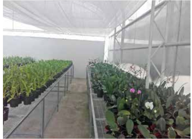
Construcción de una nave en el orquideario