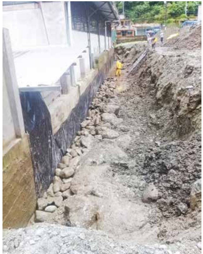
Impermeabilización de la pared del coliseo