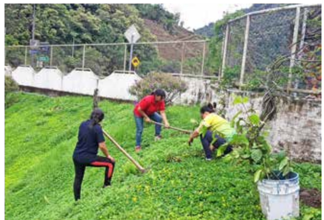
Siembra de plantas en el orquideario