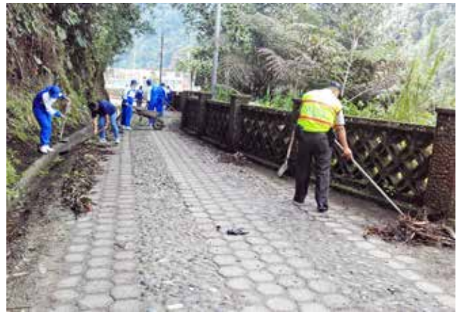
Apoyo de la Escuela de Policía Baños