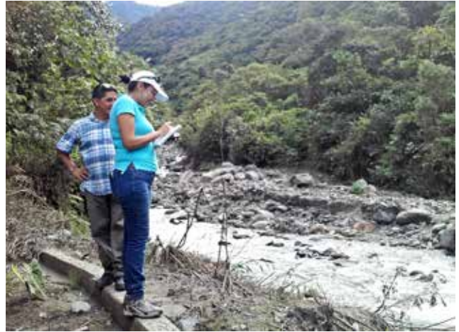
Recorrido con técnicos de SENAGUA para la obtención de permisos para desazolves