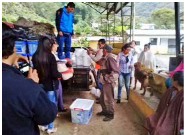
Activación de albergue en temporada de emergencia invernal