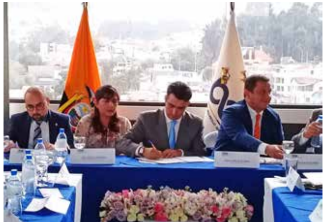
Banco de Desarrollo del Ecuador (BDE)