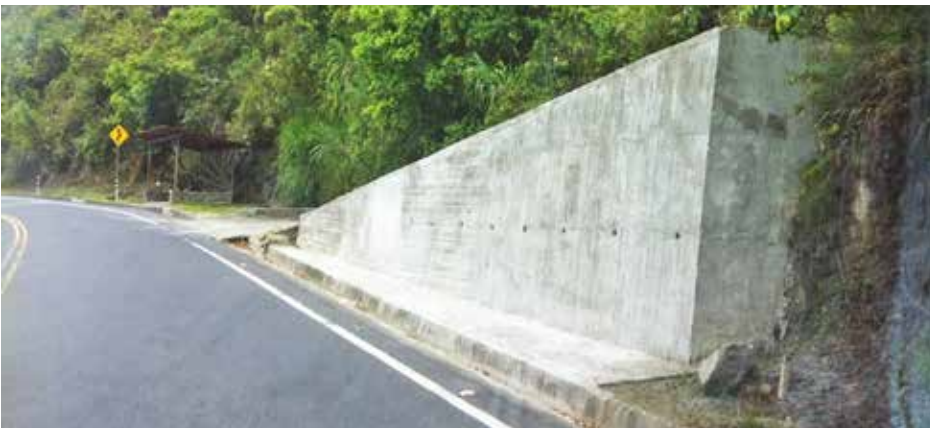
Muro de protección de la vía hacia las comunidades El Puyal y El Corazón